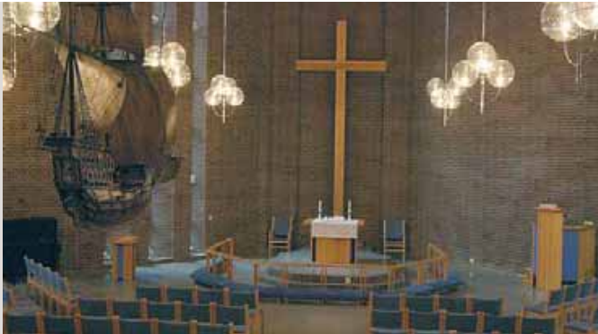
Interior fra DELKs kirke på Ryenberg, Oslo.