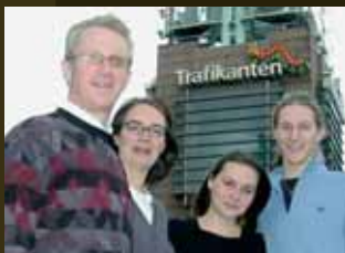
En voksende menighet – men ikke med annonser (s.18)