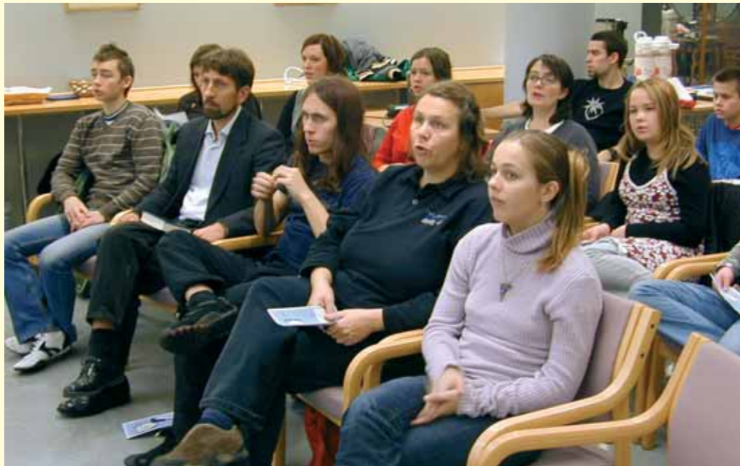
Messiaskirken er foreløpig en ungdommelig forsamling. Men de arbeider for å nå hele aldersspekteret.

Masvie peker på at bakgrunnen for denne praksisen er at Messiaskirken ønsker å føre arven fra apostlene videre.