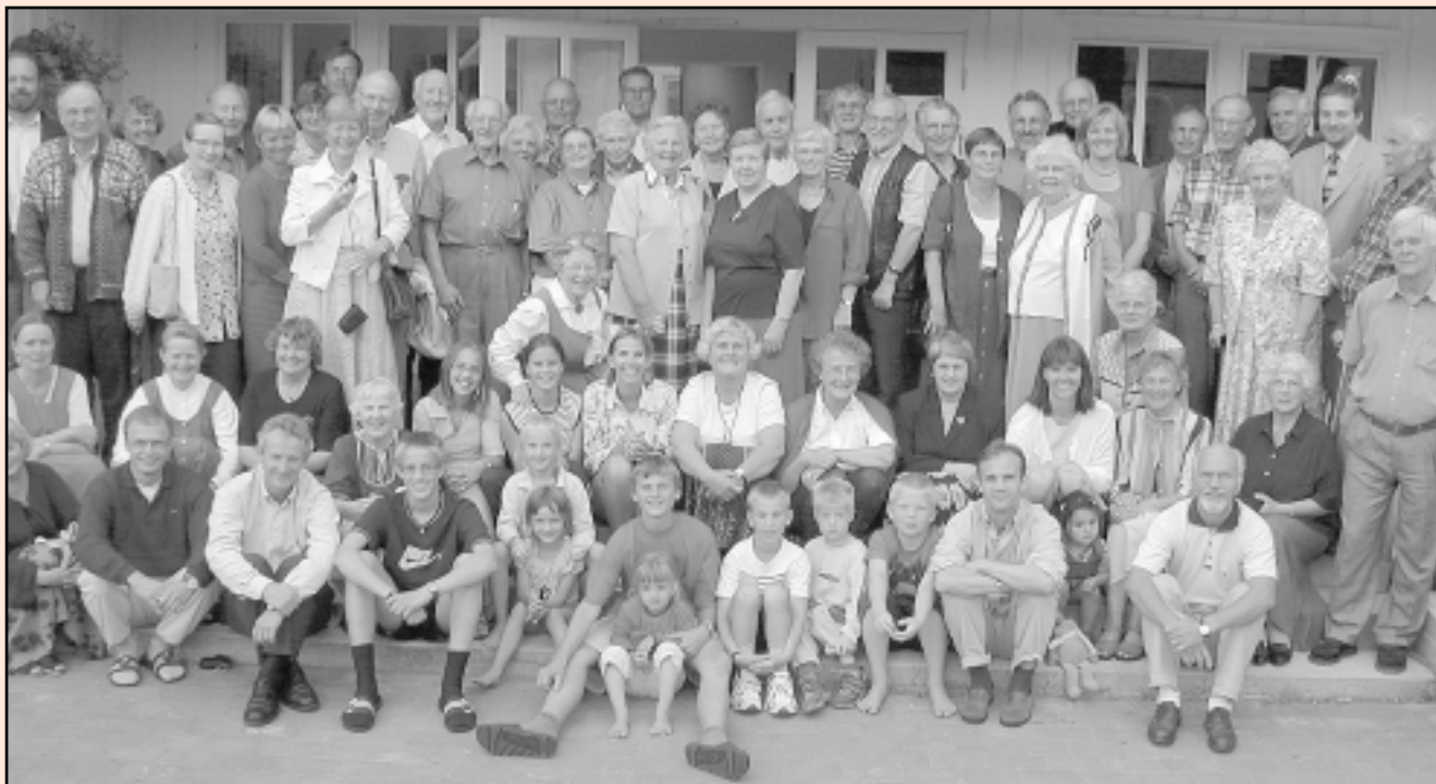
Sommerstevne på Audnastrand 18.-21.juli.