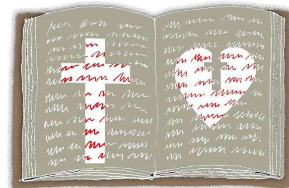
Illustration: Jens Nex